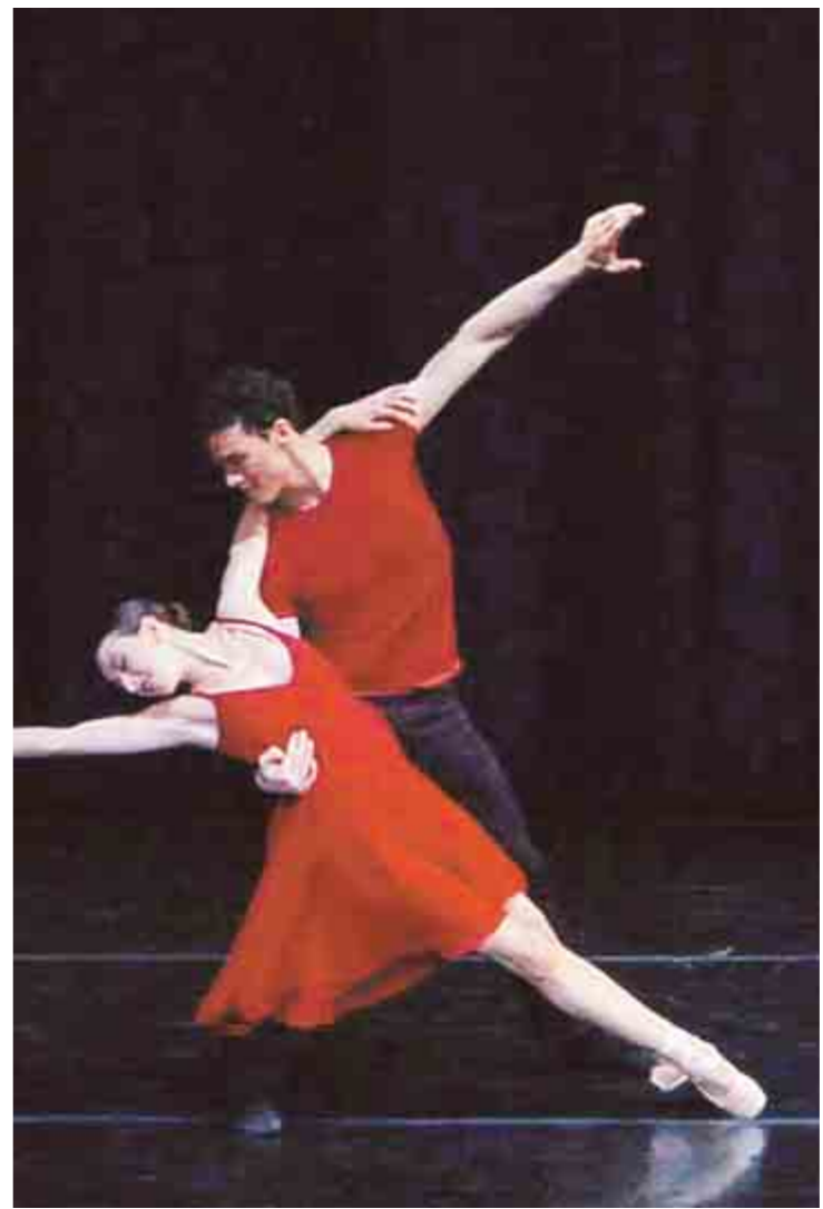
Harmonie, auch farblich: Szene aus „Without“.

Hoffentlich doch mit Absicht wird Millepied den Forsythes „Stepsex“ zwischen seine Stücke geschoben haben: Es braucht etwas, das dazwischenfährt, das mehr ist als eine Elevinnenvorstellung von Ballett. Damals hatte Forsythe erst angefangen mit der Dekonstruktion des Neoklassischen, aber die Energie und leichte Ruppigkeit des Stückes wirken an diesem Abend, als habe jemand die Türen geöffnet für einen frischen Wind.